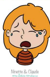
Ninette & Claude mes filles émotions

Comme pour chaque corps de métier, au fil des jours, j'adapte mon travail, mon écoute. J'observe que les échanges téléphoniques sont plus longs au fil des semaines. Chacun fait son petit bonhomme de chemin.