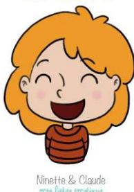
Ninette & Claude mes filles émotions